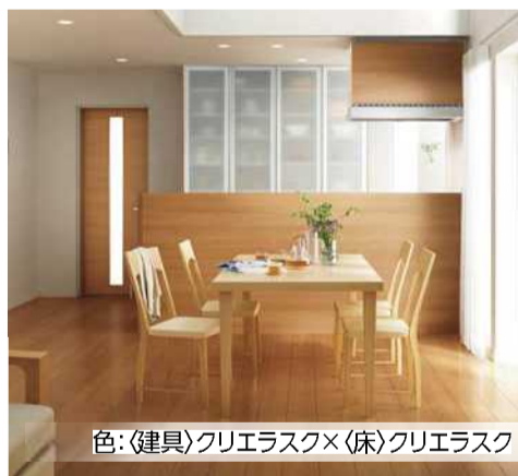
色:〈建具〉クリエラスク×〈床〉クリエラスク

家の中は大きなひとつの空間。ひとつの空間だからこそ部屋の雰囲気は統一させたいものですね。リビング建材「ウッディーライン クリエカラー」は木の本来持つ自然な風合いや色味を表現した新しい5色のカラー建材です。クリエホワイト、クリエパール、クリエラスク、クリエモカ、クリエダークのそれぞれにカラーキーワードがあり、お部屋のイメージを実現させやすくなっています。