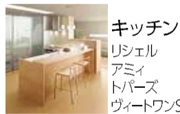
キッチン リシェル アミイ トパーズ ヴィートワンSK

キッチンから床、収納、建具などさまざまな商材でリエカラーが選べるようになりました。空間をつなぐ1棟のコンセプトのカラーとして、家の中をトータルコーディネートすることが可能です。