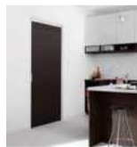
建具 ウッディーライン