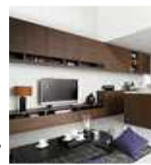
収納 タスボックス