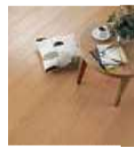
床 ハーモニアス ライト 12E