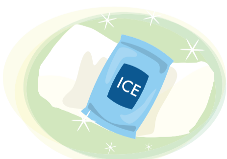
目を冷やすときは、保冷材もおすすめ！冷凍庫から出して少しやわらかくし、冷たさを調節してからガーゼなどを巻いて使しましょう。

目へのごほうびに、就寝前に温めれば、リラックスにもなりますし、翌日も爽快です。最近では、温感アイマスクも市販されているので、取り入れてみるのもいいですね。目がショボショボして、充血もしている、という場合は、温めると冷やすを交互にして、目の周りを収縮させることで、ラクになるそうです。 手軽な方法で毎日、クリアな視界を保ちましょう！