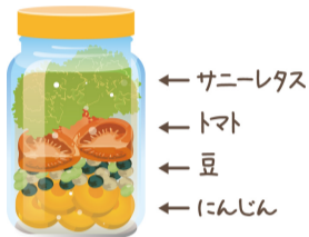
← サニーレタス ← トマト ← 豆 ← にんじん

ジャーサラダをつくるポイントは、底にドレッシングを入れて、固い野菜から入れること。たとえば、下からにんじん、豆類、きゅうりなど。トマトやアボカドなどやわらかい野菜はその次に。最後に葉ものを入れてふたをすれば完成！持ち運びにも便利なので、お弁当の副菜にもおすすめです。しっかり密閉できれば3～5日は持つそうです。ぜひお試しあれ！