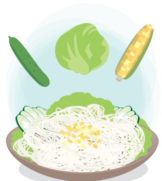
サラダうどんは普通の太さのう どんでも良いですが、細めの稲 庭風なら、より味がからんでお いしいです。