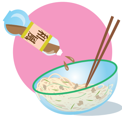
和風パスタは炒めた具とゆでたパスタを ボウルに入れて、和風ドレッシングをあ えてもできます。

はきゅうりやカニかまぼこ、細かく 刻んだわかめ、スイートコーンなど を使えば、彩りも鮮やかです。ほか には、鶏もも肉を焼いて、青じそド レッシングをフライパンに入れてか らめながら仕上げれば、さっぱりと した味が楽しめます。