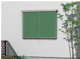
Basic style フック固定タイプ