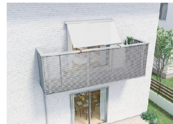
Balcony style 手すり固定タイプ