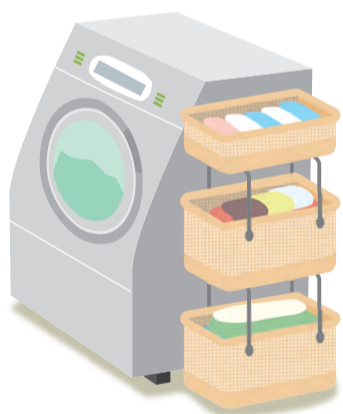
カゴが縦に連結したタイプなら省スペースでできます！