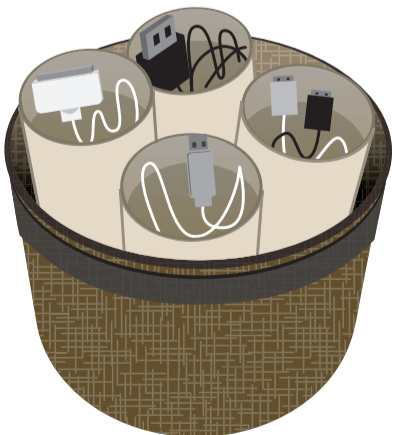
出し入れもラクチン♪