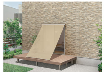
Deck style デッキ固定タイプ