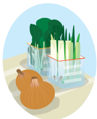
ねぎは青い部分と白い部分を切り分けておくと使いやすいです。

野菜室も見やすくしましょう。ニンジンなどの根菜、ほうれんそうなどの葉物野菜は立てて保存すると長持ちするので、ペットボトルを適当な長さに切り、切り口をテープなど