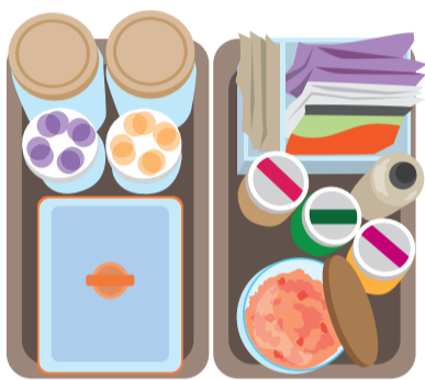
朝食セットはシンプルなトレーにまとめるのもおすすめです♪

理できます。わさびなどのチューブ類はフック付きのクリップに挟んでドアポケットの前面に引っかける、省スペースに収納できます。