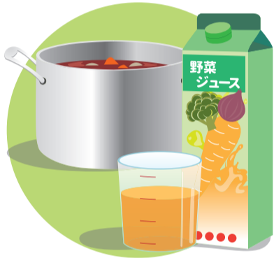
カレーをつくるとき、野菜ジュースは入れ過ぎると酸味が立つので、水と同量が少し少ないくらいが良いです

●カレーは、肉や野菜を炒め少量の水を入れて野菜に火が通るまで煮込んだら、野菜ジュースを入れてさらに煮込みます。市販のカレールーを入れてもいいですが、野菜ジュースだけでも充分味わいがあるので、カレー粉を使い、しょうゆやウスターソースをプラスして味を調えるのもおすすめです。