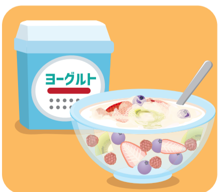
フルーツポンチは、プレーンヨーグルトをりんごジュースの半量入れるとプルプルとして、さっぱりな味わいが楽しめます

て少し炭酸水を加えてしゅわっとさせても良いですよ。 ●りんごジュースのようなかんは、鍋にりんごジュースと粉寒天を入れて溶かし、グラニュー糖を入れて弱火でゆっくりにかき混ぜます。2、3分煮たら、白こしあんを少しずつ加え、なめらかになるまで混ぜたら火を止めます。少し冷めたら、ラップを敷いた深型の皿などに流し込んで冷蔵庫で1時間ほど冷やし固めます。