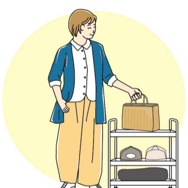
たとえば、普段使いのバッグを置くなら、腰高くらいの位置だと、ムリなく取ることができ、中身の出し入れもしやすいです。

もつまずくことがあるそう。また、座布団を踏んで足を滑らせてしまう恐れが。温かみのある雰囲気は良いですが、ラグやじゅうたん、座布団がないことで掃除がラクになり、大きな敷き物の洗濯の大変さから解放されるといったメリットも。検討の余地ありではないでしょうか？