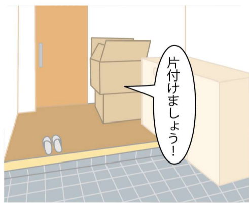
玄関ホールに宅配の荷物などのモノを放置すると、出入りの際にじゃまになり、つまずきの一因に。届いたら、すぐにモノを出して片づけましょう。

土鍋や大きな鍋など、重いモノを収納棚の上の方に置くと、出し入れの際に思わぬケガにつながる危険が。