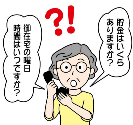
電話などで在宅状況や家族の状況、資産状況を聞かれてもむやみに答えないようにしましょう。

不意の訪問や電話 普段の行動にもご注意を！ 強盗は宅配業者や公共業者を装うなど巧妙化。対応する際には、必ずインターホンで事前確認を。また、水道の確認をさせていただきます。というケースも。公共機関の業者には警戒も薄くなりがち。そのような心理を巧みに利用してきます。そもそも