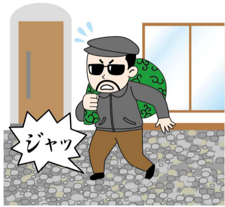
歩くとき大きな音がする防犯砂利というものもあります！建物の周辺に敷くと効果的です。

ことも手です。わずかなすき間にバールを入れてドアをこじ開ける手荒なやり口もあるので、鎌付きのデッドボルト（カンヌキ）タイプの鍵への交換もおすすめ。最新のドアは不正解錠しづらい構造のシリンドアールや、鎌付きデッドボルトを採用したタイプもあるので、相談してはいかがでしょうか？ 窓も対策が必要。洗面所やトイレなど、小窓でも換気以外は施錠を。リビング以外の部屋の窓、特に2階の