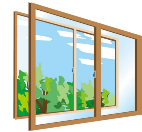
内窓の設置もおすすめ。窓を開けるのに時間を要します。

ことも手です。わずかなすき間にバールを入れてドアをこじ開ける手荒なやり口もあるので、鎌付きのデッドボルト（カンヌキ）タイプの鍵への交換もおすすめ。最新のドアは不正解錠しづらい構造のシリンドアールや、鎌付きデッドボルトを採用したタイプもあるので、相談してはいかがでしょうか？ 窓も対策が必要。洗面所やトイレなど、小窓でも換気以外は施錠を。リビング以外の部屋の窓、特に2階の