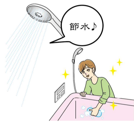
最新の設備にすることで、節水などの省エネや掃除がしやすくなるといったメリットも。