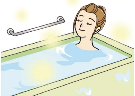
新しい浴室で快適さをアップデートするのも良いですね！

を解消したい、デザインを一新したい、新たな設備や機能を追加したいなど、リフォームの優先順位を考えておくと、相談がスムーズです。また、機能やオプションを追加すると費用は高くなるため、優先順位を考えることは、工事内容を絞りやすくすることにもつながります。 事前にリフォームの費用相場を調べ